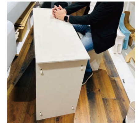
テーブル・スツール

上記アイテム以外にも各種対応できます。まずはご希望やイメージなどをお聞かせください!