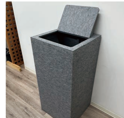
リサイクルボックス