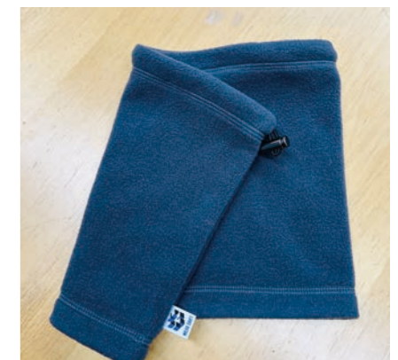
フリースネックウォーマー