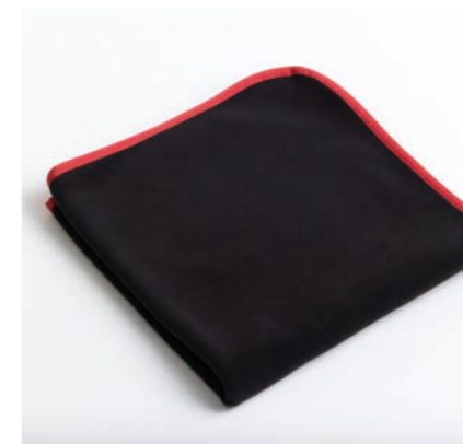
フリースブランケット